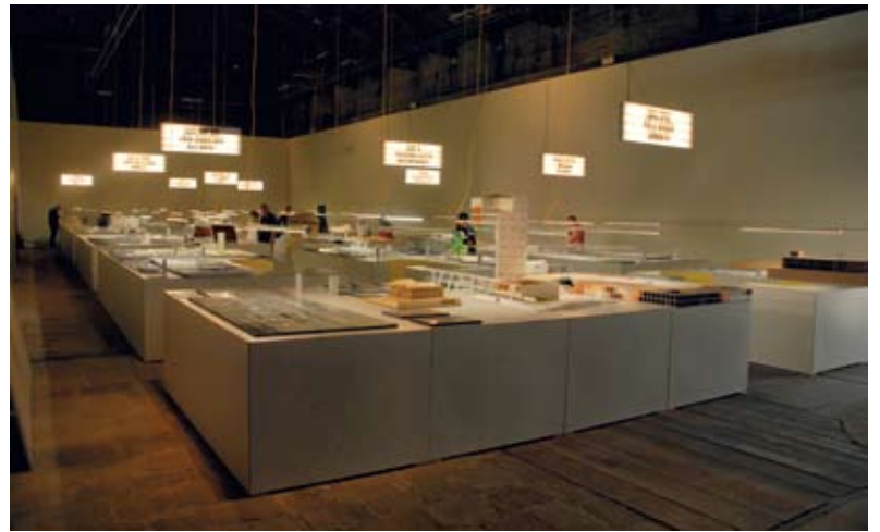
► The Truffle es una habitación en la Costa da Morte. A la der. La instalación de los dueños de casa, Italia, que reflexiona acerca del espacio público.

la materia en material de arquitectura, mostradas como elementos que evidencian el desgaste del uso.